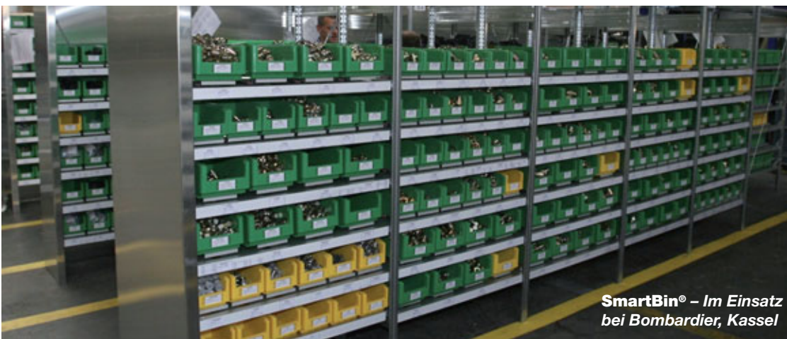
SmartBin® – Im Einsatz bei Bombardier, Kassel

Diese positiven Erfahrungen haben uns motiviert, das SmartBin® System auszuweiten und weitere C-Teile mit aufzunehmen.“