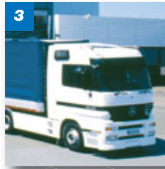
Kommissionieren und Ausliefern

2 Die Bestandsinformationen stehen 24 Stunden online zur Verfügung. Bei Unterschreitung des eingestellten Beschaffungslimits generiert die Software eine Bestellung und leitet diese an das Böllhoff eigene ERP-System weiter.