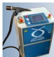
EPK Compact con control de la calidad de la colocación integrado.