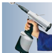
RIVKLE® P2005 para la colocación por recorrido de M3 a M12.